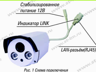
Рис. 1 Схема подключения