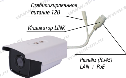
Рис. 1 Схема подключения